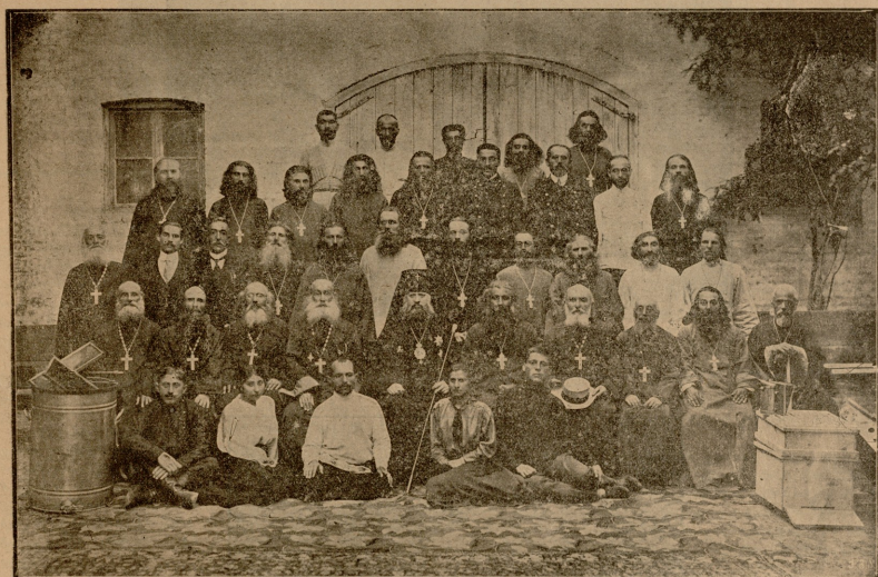
მთავარეპისკოპოსის კარსები სამღვდლოებისა და სამკურნალო საკლასო განსწავლავებულთათვის.