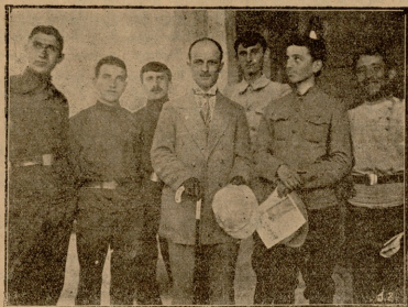
ძუთაინის ქართული გიმნაზიის მასწავლებლები ალავერდის მონასტერში.