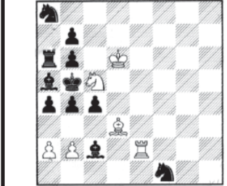
შავთათ 12 სვლაში