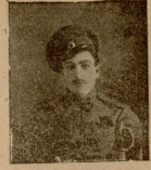
პრ.პ. დავერტი ხარამ. ფავარიძე (მოკალულია).

შალვა. სრულიდ არაფერი! ვახტანგი. იქვე შეპარება. შალვა. ტყუილა: მე ყოველთვის მიყვარდა სიმართლის თქმა. გიორგი. გიყვარდით? მაშ ახლა? შალვა. ახლა მით უმეტეს. ვახტანგი. ყოველი პარტიისანი აღმანიის თვისება! შალვა. (გესლიანად) მაშასადამე თქვინიც. ვახტანგი. ოღონდაც! თამარი. ბ. შალვა, თქვენ მჭრელი ენის პატრონი ყოფილხარო. შალვა. ხე! ხე! ხე! ყველა მოუსვენარი ენის თვისება. ვახტანგი. ხანდახან მეტყირრობაც. შალვა. ზოგჯერ ისეც საჭიროა. (შემოდის ოთარი და მანუჯარი). ოთარი. მომიმოკეთ, ყველაფერი მოეწყო. გიორგი. ანაფილოცავს. ოთარი. ახლა მხოლოდ რეკლამა საჭირო და ამასაც ზეალი- დან შეუდგებით. ჩვენ გაბუნოში დღი აღვილი ეჭნება დღემოძლი, საღამის მოწყობას. ოღონდ ჩაივილდეს კარგად და მეტო არაფერი მინდა.