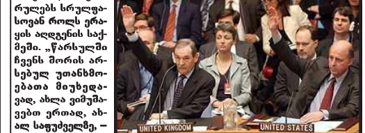
ბაერომ ერაყის წინააღმდეგ შეიქმნილი საფრთხე მოხსნა.

ბაერომ ერაყის წინააღმდეგ შეიქმნილი საფრთხე მოხსნა. ბაერომ ერაყის წინააღმდეგ შეიქმნილი საფრთხე მოხსნა.