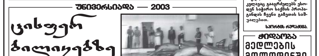
გაათამაშეს „ნონს თსი“.

გაათამაშეს „ნონს თსი“. გაათამაშეს „ნონს თსი“.