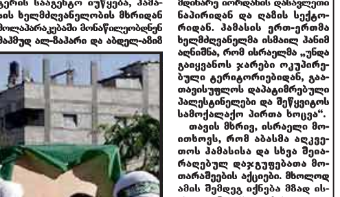
აბასის შეხვედრა პამასთან უმედოდა დასრულდა.

აბასის შეხვედრა პამასთან უმედოდა დასრულდა. აბასის შეხვედრა პამასთან უმედოდა დასრულდა.