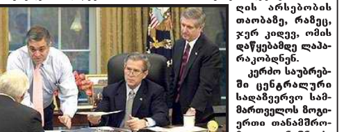
ცენტრალური სადაზვერვო სამმართველო კრიტიკის ქარცეცხლში ექცევა.

ცენტრალური სადაზვერვო სამმართველო კრიტიკის ქარცეცხლში ექცევა. ცენტრალური სადაზვერვო სამმართველო კრიტიკის ქარცეცხლში ექცევა.