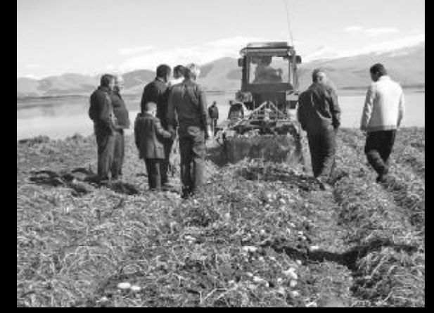
სანამ ჯერ კიდევ არ არის გვიან, უნდა ვუზვალთ სოფელს მარჩინალს

ბენ ოჯახებს და მოდიან ქალაქში სეზონური მუშახელის პოზიციის საძებნელად, ლუკმაპურის საზოგადოებრივ მოსახლეობა სერიოზული მიგრაცია, რასაც სახელმწიფო მოუწყურა ყური და ცნობილი სამი მაიმუნის პოზიციაში ჩადგა — ვერ ვხედავ, არ მესმის, არაფერს ვამბობ. არადა, სოფლის მეურნეობა ურთულესი მექანიზმია, დაგვეცალა სოფლები.