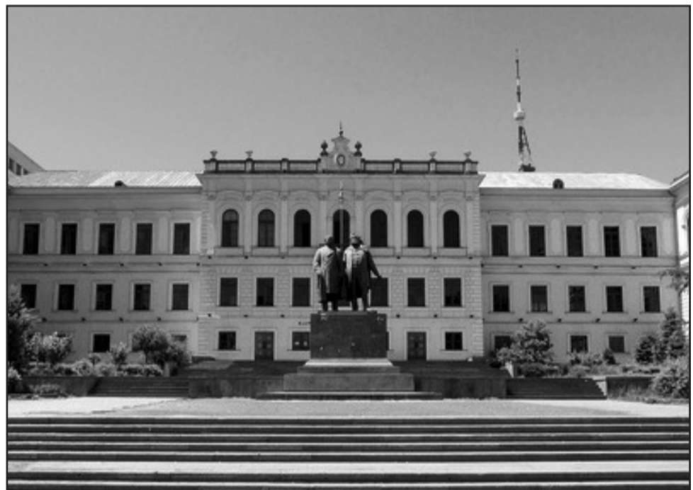
ნუ დაგავიწყდება, რომ 1992 წელს ქართველების მიერ დანგრეული ამ ისტორიული სკოლის შენობა მოსკოვის მერიამ აღადგინა.

თქვენ იცით ხოლმე, როცა სიმღერას გაათავებთ, იტყვიოთ: თქვენი გამარჯვებისა იყოსო. მეც გავათავებ, რაც სათქმელი მქონდა და თქვენებურად, ჩვენებურად გეუბნებით: “თქვენი გამარჯვებისა იყოს!”