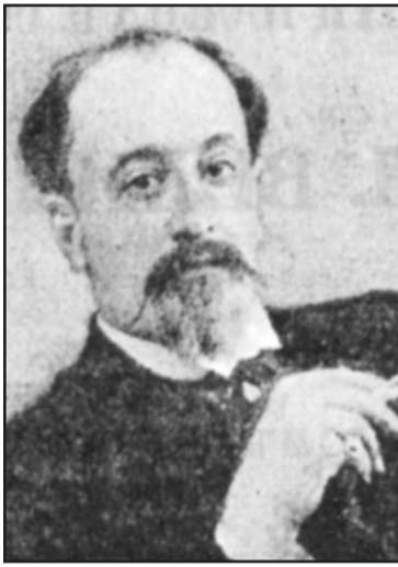
დრო უნდა "განვაახლოთ".

1904 წელს, ამ წიგნის ავტორის ვასილ ველიჩკოს გარდაცვალების შემდეგ, მისი მოსწავლეების მიერ „კავკასიის“ წიგნად გამოცემა ძალზე ააფორიაქა მთელი პლანეტის სომხური მოსახლეობა. ინგლისში მცხოვრებმა სომეხმა დიდგვარმა გულბეგიანმა იმ დროისათვის ზღაპრული თანხა – ხუთი მილიონი ფუნტი სტერლინგი (დღევანდელი კურსით, დაახლოებით სამასი მილიონი დოლარი) – გადაიხადა, რათა ამ წიგნის მთელი ტირაჟი გაყიდულიყო ამოღებულ და გაუნადგურებინათ, მაგრამ, როგორც ხედავთ, ვერაფერს გახდა. თუმცა, სომეხებმა ნაწილობრივ მაინც მიაღწიეს საწადელს, რადგან წინამდებარე წიგნი გახლავთ ვასილ ველიჩკოს მილიონი ნაშრომის პირველი ტომი, მეორე ტომი კი, საერთოდ აღარ გამოშვალა და, ჩვენი დიდი ძიების მიუხედავად, მაინც ვერ მოვახერხეთ მისი პოვნა. როგორც ჩანს, ამ ტომის ხელში ჩაგდება და განადგურება გარკვეული საზღაურის ფასად მაინც მოახერხეს სომეხებმა.