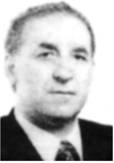
კლიმენტი შელიას წინამდებარე სტატია დაწერილია მისი ახლახან გამოსული წიგნის „კოლხეთი – ჩვენი სამყაროს კარიბჭე“ და მისივე უკვე კომპიუტერზე აწეული მოთავალი წიგნის „კაცობრიობის ისტორია კოლხეთით იწყება“-ს მიხედვით

იბერიად იწყება კოლხეთით, კოლხეთშია ქართული და მსოფლიო ცივილიზაციის სათავე.