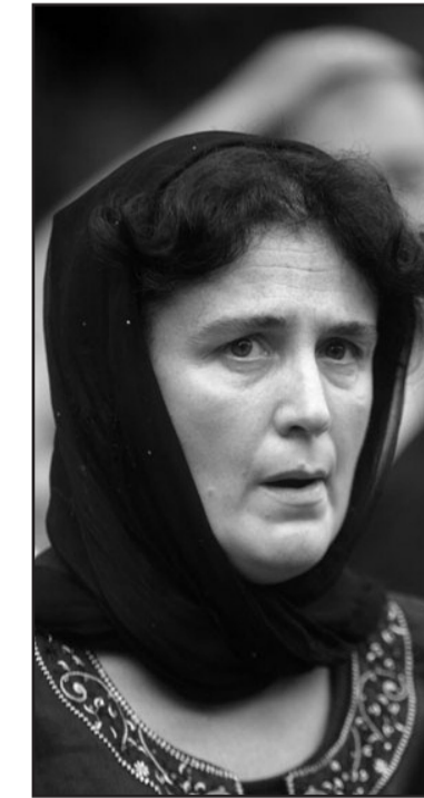
ტანჯული დედა, რომლის სული მუდამ სამართლიანი გადაწყვეტილების მომლოდინე იქნება

ამიტომ, ძრწოდეთ დამსახურებული სასჯელის მოლოდინში, მკვლელებო და კაცთმოძულე არაადამიანებო!