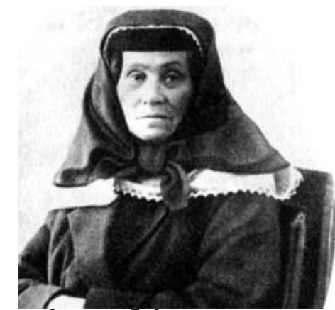
სტალინის დედა - კეკე

მოამზადა გიორგი გიგაურმა, გაზ. “ახალგაზრდა”, №50, 2009 წლის დეკემბერი.