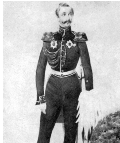
აფხაზეთის მთავარი მიხეილ (პამუთ-ბეი) გიორგის ძე შარვაშიძე-ჩანბა