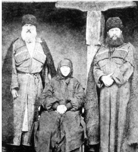
გიორგი შარვაშიძის ბებია – ბარბარე ისლამის ასული და დეშქელიანი-დადიანისა და ბიძები კონსტანტინე (კოწია) და გიორგი დადიანები