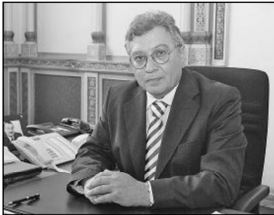
ქართველი მეცნიერები გულწრფელ სამიხარო გაცხადებენ როგორც ჩვენს აზერბაიჯანულ კოლეგებს...