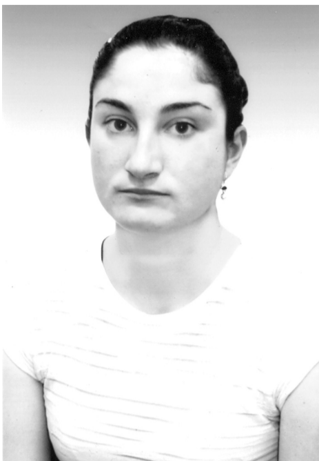
იშვილი – მედეა და – ჯადოქარი კირკა.

ჩემი ჰიპოთეზა გააძლიერა აიზენბერგის კონფერენციაზე ქართველი გია კვაშილაგას მოხსენების წაკითხვამ. ათწლეულების წინ ავსტრიელი პროფესორი პერბერტ ძებიშის მოსაზრებებზე დაყრდნობით "პელაზგური ენებისა" და მათი კავშირის შესახებ თანამედროვე ქართულთან, მან თავისი კომპიუტერი გამოიყენა -ხაზოვანი დამწერლობისა და ძველი კოლხურის შედარებით ანალიზისათვის. კვაშილაგამ დაასკვნა, რომ არა მხოლოდ ტექსტია კოლხური, არამედ ის კრეტაზე ჩამოიტანეს კოლხების ქურუმებმა – კორიბანტებმა... ამ ენაზე მეტყველებდა მინოსის მეუღლე პასიფაე, რომელიც კოლხეთიდან იყო, ისევე, როგორც კოლხეთის მეფე – აიეტი, მისი ქალ-