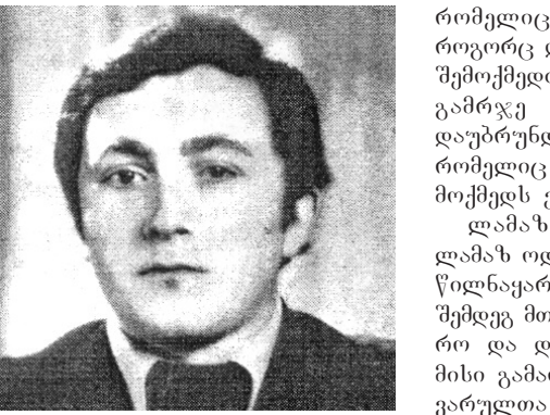
"რა აღვიღია სიკვდილი, როცა ასე ბიჭვარს სიცოცხლე"

წელს პოეტი თამაზ ბაძაღუა 52 წლისა გახდებოდა. სანუგეშოდ დაგვჩნა მხოლოდ ის, რომ ტრაგიკული სიკვდილის შემდეგ, ორ ათეულზე მეტი წლების გასვლიდან, სულგანათლებული თამაზი ახალი კრებულით მოველინა მკითხველს: "სიზმარში მაინც ვხვდებით ერთმანეთს". კიდევ ერთხელ, საკუთარი წიგნით ხელდამშვენებულად შეაბიჯა ვირტუალურად თავის მშობლიურ კუთხეში დიდებული მა პოეტმა და პიროვნებამ, რომლის შემოქმედება საკუთარი ტრაგიკული ბედის ნოსტრადამუსისეული უტყუარი ჭერებია გახლდათ. იგი დაუბრუნდა მარტვილს, რომელიც ოდითგან ცნობილია როგორც დიდ მამულიშვილთა, დიდ მეცნიერთა და გამრჯე პატრიოტთა აკვანი. დაუბრუნდა მარტვილის მუზეუმს, რომელიც სულგანათლებულ შემოქმედს ესოდენ უყვარდა.