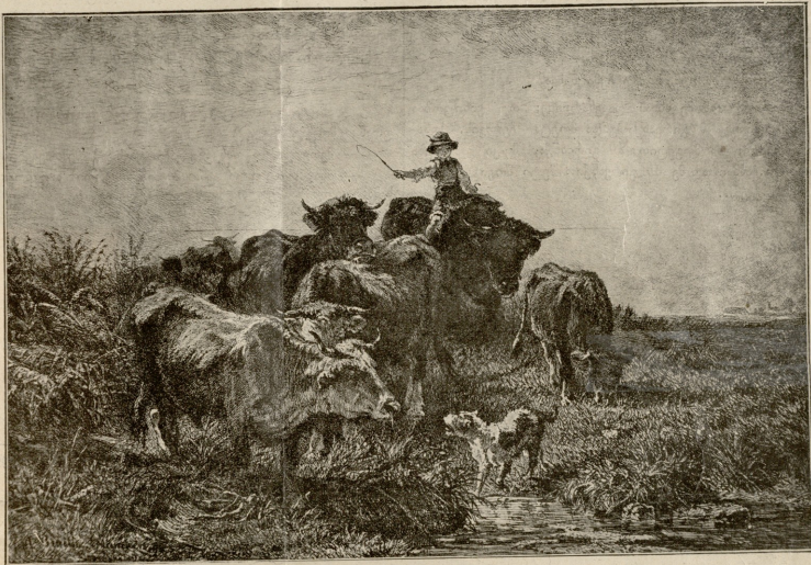
სოფლის სურათი, ბრატის ოფორტადან გადაღებული.

თის შემდეგ კიდევ გაიარა მის მახლობლად და კიდევ შეიშმუშ- ნა მხრები.