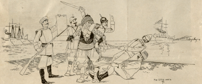
აღლაშა უწყის რა უნდათ ჩემგან!

— მერე და რა დასკვნა გამოაკავს ამ შემთხვევიდან? — ისა, რომ ფორტუნა (ბედის ღმერთი) თუ ბრმა არის, სამაგიეროდ მას ყურთა სწენა არ ჰკლებია.