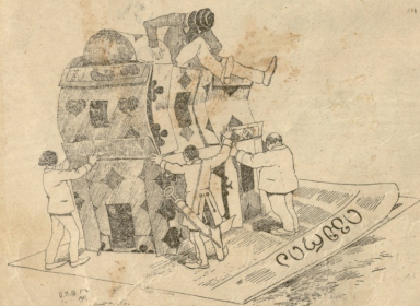
ვინ ნაშრომი, ნაღვაწო, დარბაზო ქალაქისთა, გაშენებ—უნე კი იტყვი, თაე-ქვე მლინარ მარტალი

ბროინციდიდან მიღებულ წერილების პასუხს, ცხადებთ, რომ მოგახმა «სტობის ფურცელს» ერთ ადღის 11 მანეთი ქალაქ გარედ მცხეთა თათვის და 10 მან. ქალაქში მცხოვრებთათვის ფანის განაწილება იხილე ზელისა-მოწაფრის განცხადებაში.