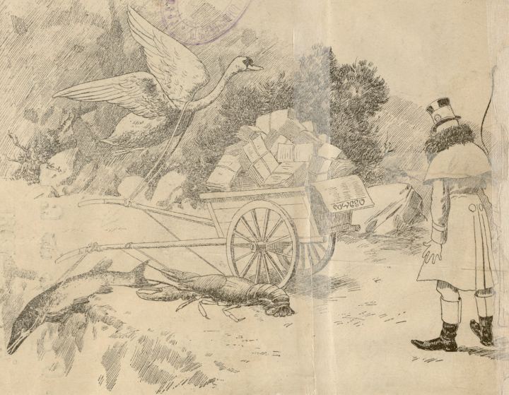
თევზმა, გემა და კიბომა, ქირა აიღეს ძალიან ბლამად: უნდა წაღოთ ბარგი თქვინა, თვითონ შევხებნენ ზოგ ურემო!