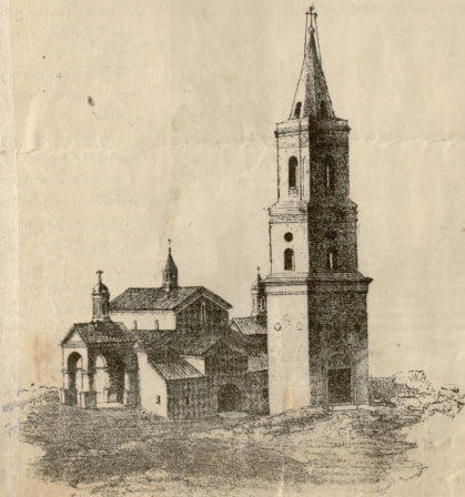
წმ. ნინოს მონასტერი ს. ზაბეგში (ქაზაუში), სადაც დაკრძალულია წმ. ნინო ხარან, ყველაფერი გიცივს, ყველაფერს კითხულობ და იპრანკ- იგრიბები?! — დავციოხა თავის თავს და გაშლილი ხელის თითები უცრს ზემოდ თავში წაიჭრა.

„სავიციეთა!“ — ბრზიანად გაჯაგრა მიხილ ივანჩმა მგზავრს და უნებურად ყვითელ შენობას კიდევ შეშხედა.