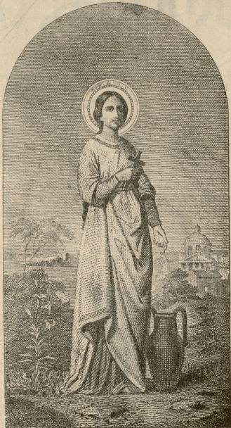
წმ. ნინო, სავანეგეთის წმინდა.

— მი, ახი შენზედ, რო დავცინეს, ახი, რას ვამი- ყმაწვილდი ეხლა, ფუ! — ნიშნის მიკვებით უთხრა თავის თავს, მიხილ ივანჩმა.