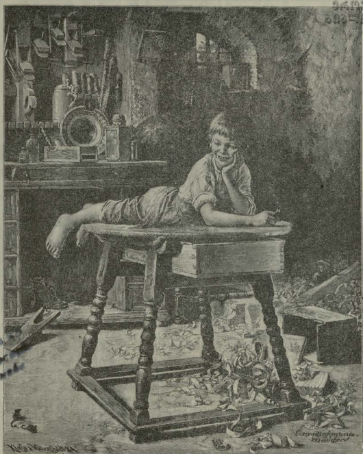
მუშაობის შემდეგ.—სურათი ბეკმანისა

—ეე, ლაშრო!—დასცინა თავის თავს მიხეილ ივანისმა, და პირზედ ღიმილი მოუვიდა.