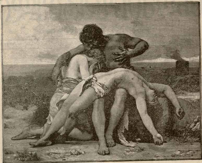
ზარეული უზარეულია. —სურათი გ. ბუგურას

ლნიკ შავივხა და გვით: —„მახელითაო? —„გახელითაო? — „დაიკადეთო, მოითმინეთო დილაზე ბილეთებსა და ფულს დაგირიგებთო და ისრ წაიღეთო“. ჩვენ გამაცხადილი მეორე დილაზე მიველით ფულად სამ მანათ და სამ აბაზი და ბილე- თები ლურჯი ფერისა მივიღეთ ჩემ ამხანაგ ხეცსურებ ამბობ- დასა რომ თიანეთით ცხენით აღარ წავიყვიანენ, ტროიკით უნ- დო წავიდათო, აიტომ ჩვენმ მამასახლისმ ბათირამ უთხრ ლახალინის: მე ცხენ გავატანეთ; იყო ბრძანებთო წინათო რომ ტროიკით უნდო წავიდათო. მემრ ლახალინეც უთხრა: შენ ბი- კო რომელი წითელი კერცხი ხარო რომ ტროიკით ვაგზავ- ნათო. ჩვენ ტროიკა თვითონ გვეკორდებსაო. მივიღეთ ფული და გავწიეთ და ლულულ სოფელში 1) დავედეთ გვრ იყო ბრძანება. ჩვენ ყახხ გვეტრანა—ქართველ იყო და ურადნიკო რუს, ჩვენ სოფელი არ შევსულივით იქ მარჯვეს დაგრიით სოფელსთან ახლოს. მეორეს დილით შევსეთ ერთი ჩარექ არაყი და წავიდით. ვიღინეთ 2) ჩავიარეთ, ყელბ 3) გარდავი- არეთ და ჩაველით ცხვირუპიში. იქ კიდე შევექიფეთო ლა- მას ლახათია არაყ გადავყარით, თუნ 4) მაშინსად ქეთ არ გვაკლდა. ქეთის შამდე შევსხელით ცხენებზე და გარდავ არეთ პატარა ყელო 5) და გაუნდით „შინსად ხეზე 6) “. იქ ლუ- ქან იყო გვინდოდ დაველოცე, პურ გვექამ, მაგრამ მაგვრანეს ურადნიკი, ყახხამა და გავყერენეს გდანზე. იქ იყე ჩვენთვის ალაგ. იქ უნდო დავმგარიყავით, ისრ იყო ბრძანებათი. ჩავე- ლით ალაგია სადაც იყო დღიწული ღუქანი გლდანზე წინ ჩასულ ხეცსურებ დამთვრალიყუნეს და ერთ უცხო ეტროდეს ხანჯრებთ: აი ოთხი იმედან შვილი და ჩაღბო ხანჯრული გამაწილეს ურადნიკებ წაართვის ხანჯრებ, დამწილ ხალხი, და უნდო დამდარაყენენ. ზოგ, ერთივე ვაიწიე წუხუ-