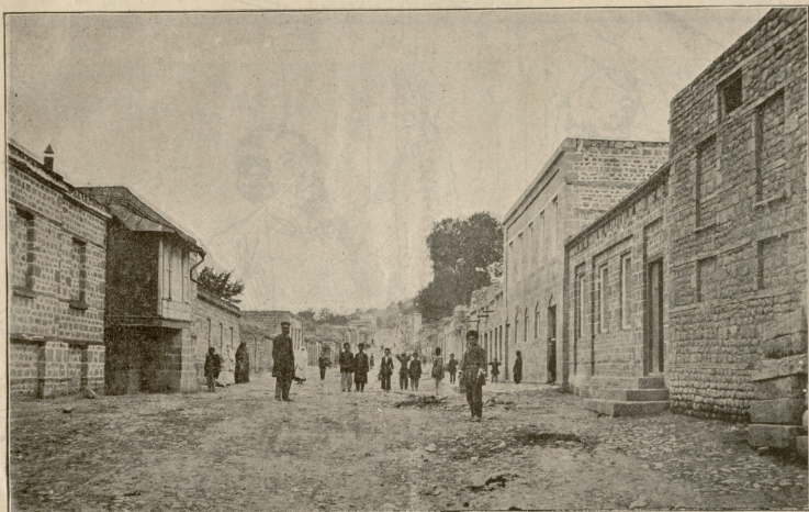
მინს პერა ქ. უკმახაშო.—საკეთესო ქება, სადგ მხოლოდ იორიოდე სახლი კაღურას დანგრევის.