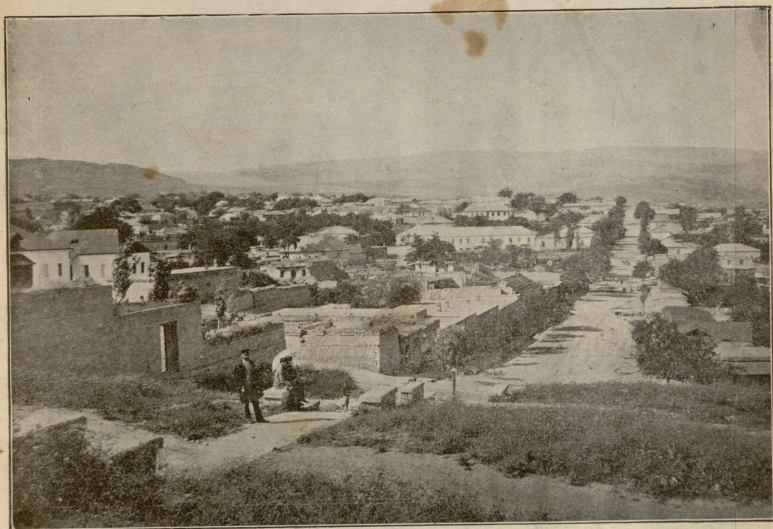
შემახა მიწის-ძვრამდე. საუკეთესო ნაწილი ქალაქისა. —აგროტოპია «ენობის ფურცლისა».