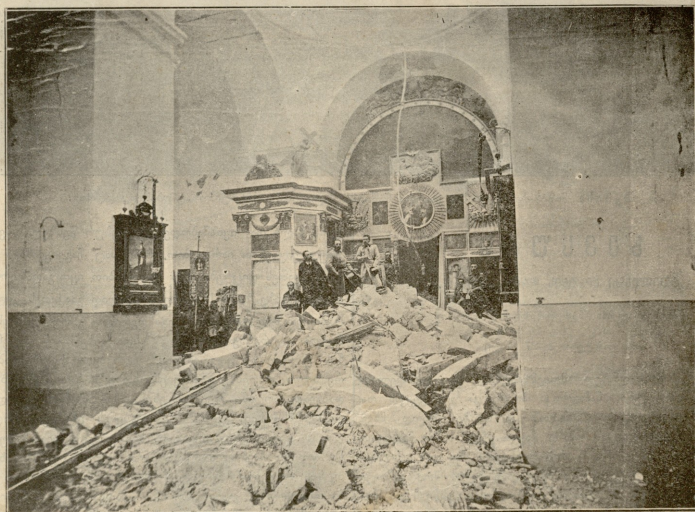
შემახა.—მართლ-მადიდებელთა ეკკლესია მიწის ძერი სშემდეგ. გამოაქვე ეკკლესიის ავეჯი. ერმაკოვის ფოტოგრა., ავტოტია „სენობის ფურცლისა“.

იყენეს შაკაშულნი. ცალკეს ვაეები დადგეს და ცალკეს კიდევ დაცნი და სულ მწყრივად სუევილა ჩვენ გვიყურებდა. შამოვიდა ერთ დიდ კაცი და გვითხრა:—დაუყურეთ იმ დიაკონოჲ, თვითონ ჩემს გვერდში დადგო და დაუწყო შაწუხებულ ძახილი რალაკს ეძახდა და ერთბაშად მურგვალნი, მთვარესავით სისვის 1) ფერი შუქი ჩამოვარდა და განათდა