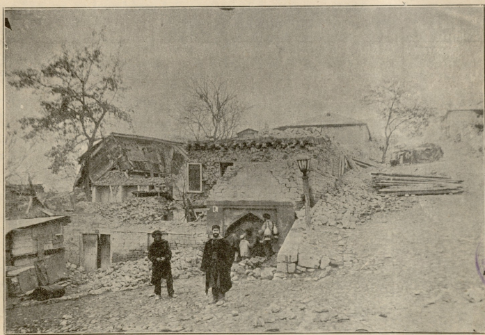
შემას. — ქოშაბულაბ და კერბალაი-ალი-აბას-ყულის სახლი მიწის ძვრის შემდეგ. ერზაკოვის ფოტოგრაფ., ავტოტიპია „ენოვის ფურცლისა.“

სრუცველა სანთლებ შვიოდეს და ჩქამობდ 1) ის სახლი სრულ. და ჩვენც სრუ აღმე 2) წავედით და ისრეც ჩამავედით და რომლისაცა ჩამოვე - ით დაიშალა ის საქმე. ახლა დათხოვნილები ხართო. შვიტლიანთ წახვიდეთ თავიანთ სადგომშია და იი ჩვენაც მიველით 3) . ასრე გვიამბ ბათირამ.