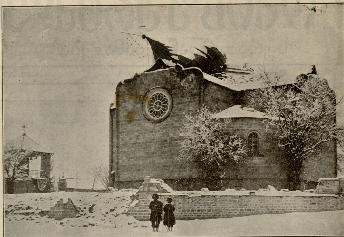
შემახა.—მართლ-მადიდებელთა ეკკლესია მიწის ძერი სშემდეგ.