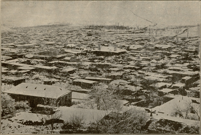
შემახა.—საერთო სურათი მკიდროდ დასახლებულ ნაწილისა მიწის ძვრის შემდეგ. ერმაკოვის ფოტოგრაფი, ავტოტიპია „სოლის ფრეზილისა“

კუთხეში, დადგეს. დიაცბე იქნებოდ იქ ათი-თორმეტ და კარგად შეჯავშნულ მართულზე იყენეს და იმ ბუჩქისა და ქიანურს, როგორც ის ბუჩქია და ქიანურ აძრახდეს, იმღერეს იმნაირად და მწკრივის ხმაზედ. იმღერეს და ჩამოვიდ კიდევ ქარტა და ველარაფერიც ვერ დაფინახეთ და დააყენებ კიდევ ბუჩქიან-ტყევიც, სანამ ქარტა აიკრიფებოდ, სანამ ი ბუჩქიანტ-ფანდურ ქიანურებს ხან ერთ ააწუწუნებდ და ხან სხვა. ზოგი წშიდა ხმაზედ წი.. წი... წი.. წი.. რო იქამს, ზოგი ბო... ბო... ბო... ბო: რო იქამს. რო... რო... რო... რო: რო: ზოგი იძახდა და ის გუჯარბე 1) ესხო წინ და ვადაშლიდეს იმ გუჯარს იმ თბებზე 2) დაიწყობდეს იმ ბუჩქიანტებს და ფანდურებს დაიწყობდეს დასაკარავად, როგორც იმათ მეუფროსე აუკრო და ჩაუკრო მალეზი ისრ იმებე ააწუწუნეს და ავიდო ქარტაც. დიდი ვაწუწუელი 3) მადანი იყო და გამოჩნდო კაცი ხელნი ალაში 4) ბქონდ წითელი ფერალი ცხენი და ზე წითელი სკალიტ 5) ბქონდა ვადაზურიელი იმ ცხენის საკანძმულობას და უკან ჯარი მოჰყვ და ხელნი სრუყველას შუბეზი ეჭირა რკინისები პტყელები ძალიანო და რკინის ჩაჩნებე ეხურა რქიანები და ერთ კუთხეში ალაგაზი დადგნენ. ესლა მეორე ცხენიანი კაცი გამოჩნდო და შავი ცხენ ჰყენდა და წითელი ტლაგარი 6) ეც იმ კაცს და უკან ჯარი მოჰყო თავისი, და იმათ კურო ხელნი, როგორც ცუდი მაგი-სიანა მიფერის ნაღვე 7) რო არის იმნაირად ბქონდ ვაკეთებულნი, როგორც კახური წაღლივით ბქონდა ვაკეთებულნი. მივიდნეს ისინი იმათ ვეფრდ ვეფრდ დადგნენ. გამოჩნდო ერთი მშვენიერი ბალი ძალიან ლამაზი, იქნებოდ რვა წლი-სა ცხრისა ვარაეოდობით. წითლებ წულები ეყო. წითლებ ტლაგარი ეყო სრუ, ამ სარტყელზე სრუ ვერცხლის ქუჩუჩი, 8) როგორც ლორის ბალანი ეგრე დამდგარი იყო, და