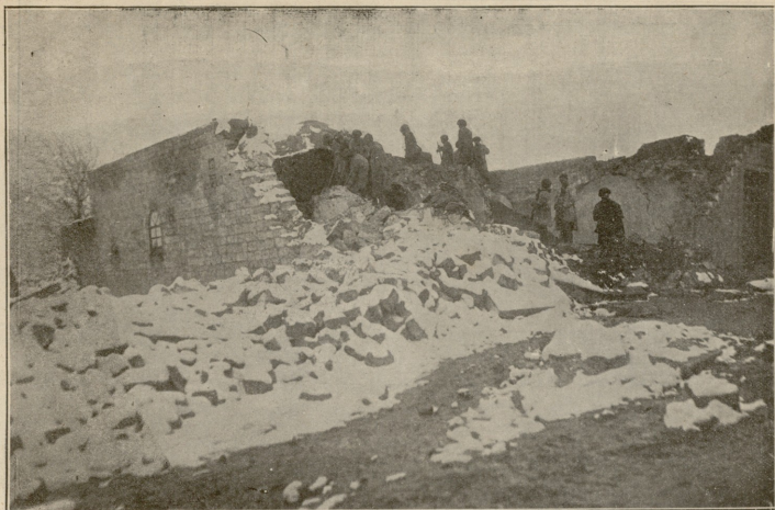
შეშენებული აბანოების მშენებლის მიწის ძვრის შემდეგ, სადაც მრავალი ქალი და ყმაწვილი დიღობდა.

რის ზოგი შვიცი; თუჯის ჯამები ედგ და იმაში ჩადიოდ ხარჯ. არ ვიცი წყალ იყო თუ ნავთი მართლა ჩვენ კი გვიჩვენებდეს. მაშინა კი ნავთისა იყო. კიდევ, ჩვენებურ ციხე რომ ის იყო ერთ რამე ვაკეთებულ: მაღალ ისე აყვანილი ძირს ეს მაშინა იყო ნავთისა; უბილეთონი არ ავიტყვის. ამოვიტყვეთ — „აი ბილეთები გვაქვს“ — ორი კაცი ავიდით ზე იძროდ თქანთქარებდ და შეგებით სრუ თავს, „მაშინელ კი იყ მაგრამ ჩვენ არ შეგშინდით რადგანაც კიუხებში და კლდეებში დაჩვეულნი ვიყავით. ჩამოვხენეთ!) ქალაქსა როგორც ხილიდან წყალს დაუყურებს კაცი ისე ი კაი სანახველ იყო იქიდან, რომ თავი ბოლო სრუ დაგინახეთ ქალაქისა; გარბოუხენით ი თავ ზევითა ხალხს, რომელიც გარბოუხენის გვერდით ბაღში ირეოდა, როგორც ბაღები ევრე, იმოდენა დაჩანდა; მანამდე არ მოგვეწყინ ვუყურეთ. ასევე ის იყო როგორც კოლი და ხრახნილია?) ბქონდეს შვითი. კიდევ ძველებს ხევსურებ ღენახეთ, მსხილები იყვნენ; ორის კაცის სიმსხინი იყვნეს და მამეტე-ბულ მაღალი. გამახარდ რომ უწინდელ ჩვენ მამა-პაპანი თვალით დაგინახე. დიდხანი უყურეთა.