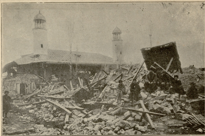
შემახს.—მგნითი „შხიზინაჲ“ მიწის ძჳრის შემდეგ.—ერზაკვის ფოტოგრაფი, ავტოტოპია „ენობის ფურცლისა“.