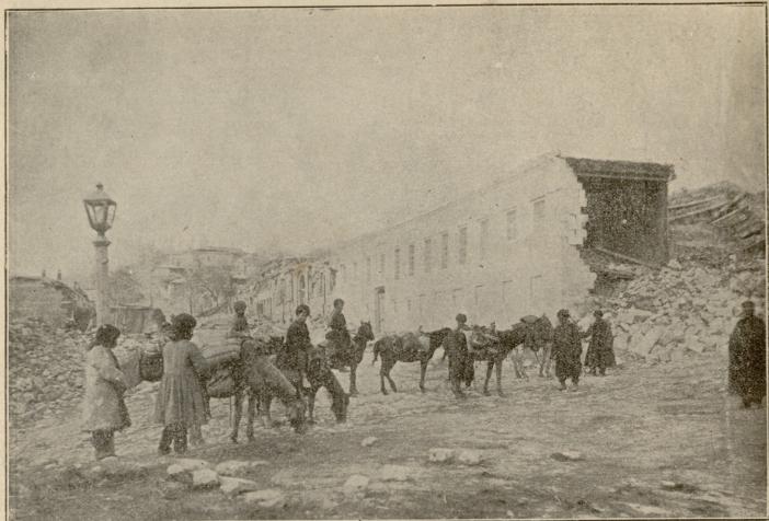
შემახა. —საუკეთესო ქუჩა შუაგულ ქალაქში მიწის ძვრის შემდეგ.