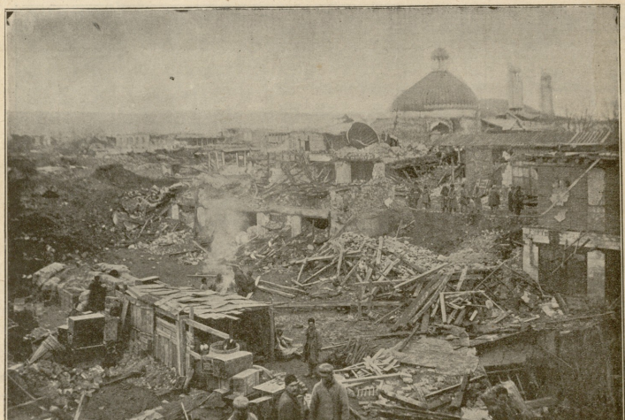
შემახა. —გუბა-მეჩეთი და იმის უბანი მიწის ძვრის შემდეგ. ერმაკოვის ფოტოგრაფი, ავტოტიპია „ცნობის ფურცლისა“

გაბენტულ, რაც სახლი მადის; ხალიჩაი ფლასი; ზარბაზანი; ნაეთის მაშინაი; კიდე წყალ ამალიოდა ღარებიდან 1) და ფიკარ იყო დადებულ; ზოგან ბაღი იყო გაკეთებული და იმას ასხემდი წყალ. 2) ზოგან კლდე იყო ამაცვანილი და ზედ ჯიხვი იცე შანხლარი ზედ; იღგ ირე-ქის თავრილი 3) ცოცხალ ეგრ იყო გამოყვანილი კლდი ან წყალ ჩამალიოდა მეგრ იქით შთა იყო გამახატული; აოჯღები იყო ისინი სრუ შიგ გამახატული. ერთგან შავიყუ-