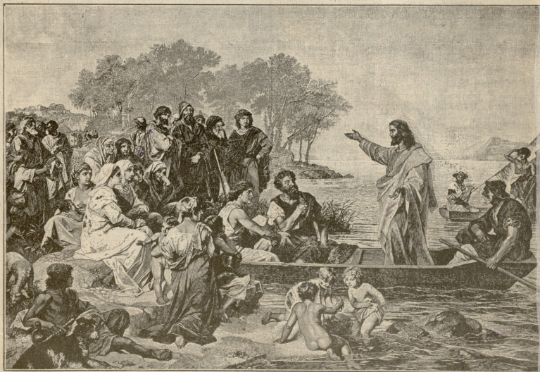
იესო ქრისტე ქადაგებს გენისარეთის ცხაფე.—სურათი ჭიფიჭიანისა

მელთა კლუბს 1 ემკნება საგულისხმიერო კრება ყოველ სამთვიურ საილის შემდეგ! 2 ბოლოში კიდევ შემდეგი დამაკვირდი იყო: „ღმერთმა გავიჩინა პირუტყვი!“ 3 აი, ეხლა კი მეგონა, ვიპოვე შემთხვევა, რომ თავი ვიჩინო, მეოქო