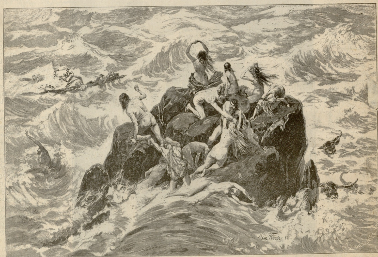
წარდგნილი შეფლას იხოლოვნენ — სურათი კასის.

სტაფილოს წვენი შესახებ ისეთ საღღერძელოებს ამბობდნენ, რომ გამგონნი ცრემლებად იღვრებოდნენ. რას წარმოვადგენდი ამისთანა დახელოვნებულებთან? ჭიკეცლა უფრო მაღლა სდგას ბოასთან*) შედარებით, ვიდრე იმითან. აგრე მე უკვე