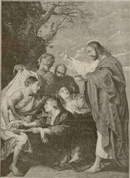
დაზარდა აღდგენა.—სურათი ზეკრე ზევე რუბენისა

სუთი დღის შემდეგ ბირმინგემში დაეკრუნდი და აუღრეკ ვეგეტარიანთა სასოვალეობაში ჩავეყრე. მხოლოდ ამის შემდეგ შევიტყე, თუ რას მოასწავებდნენ მათი განგაში და საყვირი, კრებები დიდ დარბაზებში, რომლებიც ყოველ გვირმწვინოვალეობით იყო გატენილი, მათი მზიარული სიღრმეები, როდესაც დამტკიცნავი ორატორები მასხარად იგდებდნენ ხორკის მუკემით და მხატვანდ მით ქარებისა, წულკავისა, ქლომინისა და თვირეტის მსხვერპლია. მე ორჯერ თუ სამჯერ ბედნიერება შექონდა შედარაჯნა ამ სასოვალეობის მეოლისდერ დროშასთან, რომელზედაც გამოხატულია ვეგეტარიანი სამოთხეში, რომელსაც