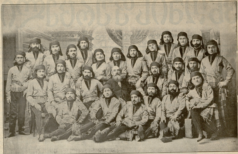
ბ-ია ფეფლიძის ქორამე და მასი ხორა.