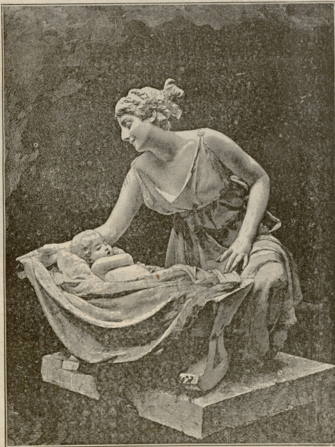
ღიღის სიყვარული.—ქანდაკება ვანდერ-სტრატისა

არ უნდოდა ამაზე ფიქრი, უნდოდა დაევიწყნა, მაგრამ ვერ მოახერხა.