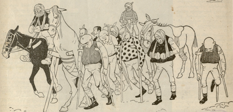
ბალახის პარკებში, კანდილაბების ჩიქლაშა.