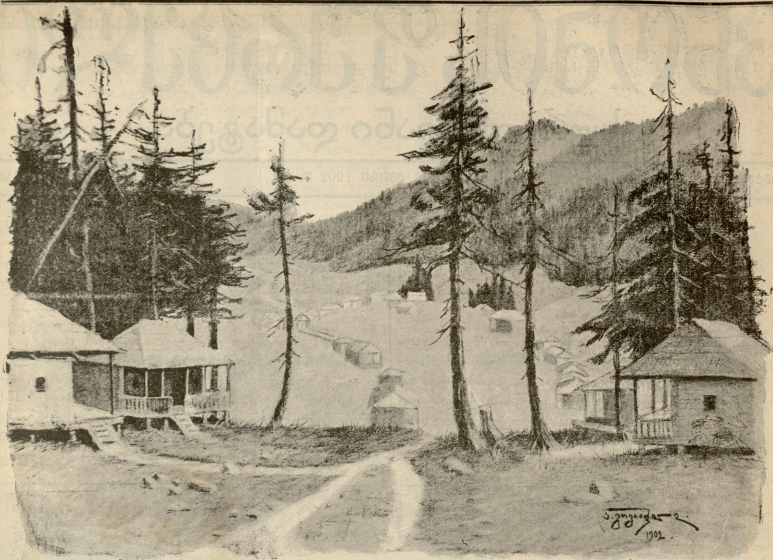
ბახმარა, საკარავო სახე. გურიაში.—სურ. გოგაშვილისა, ავტორთან — ნახაის ფურცლისა.

სავით. ერთ კვირას საქადაგებლად ავიდა, მოჰკიდა ღვთის შრომლის დროშას ხელი და დაქნია.