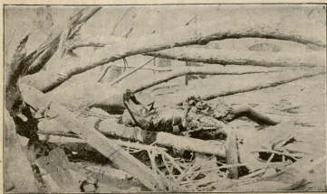
დაშვარა ქვის გვაში.