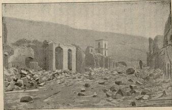
ვიტორ ჰაუსის ქუჩა, კატასტროფის შემდეგ.