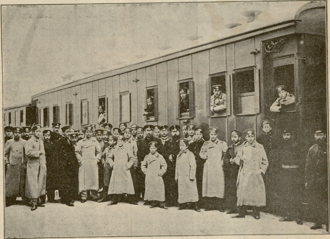
ტრუვისის მისწავლეთა რუსეთში მოქსურთა წარსულ ამბოში. რენის კხას სადგურზე.

ციწრო ღ დაქანებულ ქუჩებთან სოფლის უკან მიღამოს საზღოვიარო ფერი ადგეს. შთელი სოფელი თითქო ერთ ღრმა გეჯაში მოქცეულია. გარშემო არტია შირი ბორცვები და ქაობები, სადაც წყალი გვალვიან ზაფხულშიაც კი არა შრება და შავად, ზეიის მგავსად შიგაა დაგუბებულ-აშორებელი. ამ ქაობების შხამიანი და ყოველგვარ სენის გამწვინ ბული ასდის. აქაურების აკროლებული ქობები თვეზის გახრწნილ შიგნეთლის და დამარილებულ თევზის სუნითაა გაეწითლი. საცოდანი და დამარილებული არიან მცხოვრებნიც. კაცები—ჩაყვითლებული ღ და