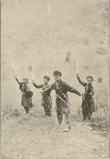
ხეყსურთა აერამა ხმლათ.

— იცით!...—ქალმა ახლო მიიწია და ხმა დაიმაღლა, თითქოს რაღაც საიდუმლოს გამებანებას აპირებდა:—იცით, მე