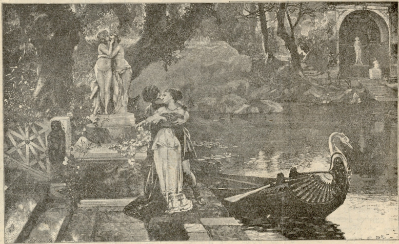
მამაშეა დემტოებს ქენრის სეპიარდასკას სურათო.

განსვენებული დიდიხადა 1848 წელს ხარკოვის მახლობლად, სადაც იმისი მამა მსახურებდა. საზოგადო განათლება მომავალმა მხატვარმა ჯერ გიმნაზიისა და შემდეგ უნივერსიტეტში მიიღო;