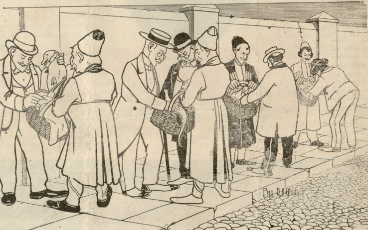
ზოგიერთა ქუთათური ხსადგარდა ათვადიერებს მზარეულთა კლავებს იმის კასკეპად, ვინ უფრო გემოელის საღლით გაუმასხინდელია.

სიცილი უფრო იმეათის ცხოველთა შორის, ვიდრე ტრილი. მკედეცრის და მტრისანი დარწმუნდეს შიშისად ძაღლის ტრილის. ვიგობრ ღ'ტრესის წინადად ფორტარაფიელი სურათებიც კი გა-დულია იმ დროს, როდესაც ძაღლი იცინოდა. როგორც დაშინათაი შო-რისა, ზოგი ძაღლი შიშისად და ღილადა იცინის, ზოგი ეიდეგ მწე-ღად და იმეათად.