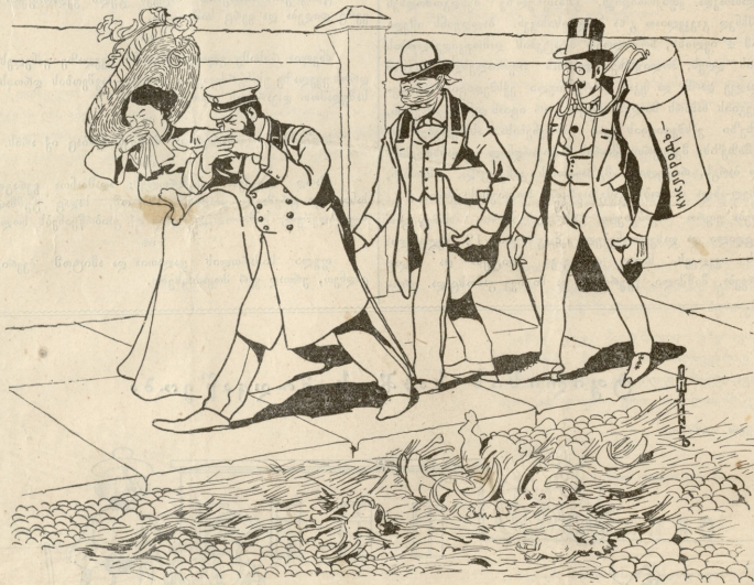
ბევრს ღაპარაკობდნენ წყენი „მამუბა“ და სანატორები ქუჩების სისუფთავზე, შავრამ....