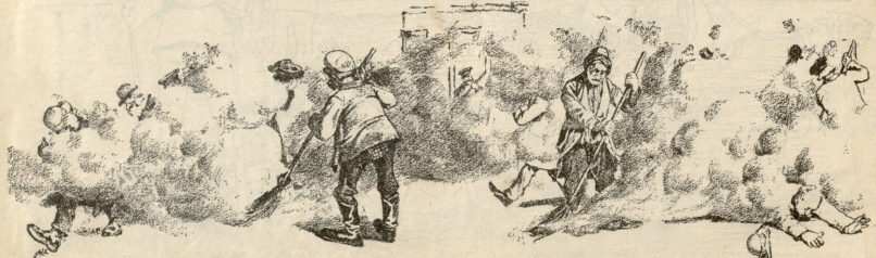
წენმა „მამუბა“ ქუჩების დაგვა თვითონ რომ ვერ შეიძლეს, სსხლის პატრონებს მოასიეს, უკეთ მოუფლადან და ხაღსს წენ-საფით მტერთათ არ შეაწუხებნით, შავრამ....