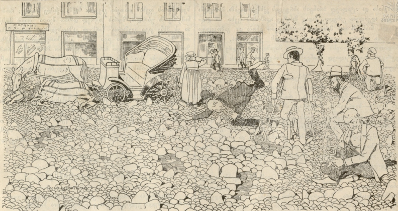
ვითომ ბევრსაც სარეზერვო ქუჩების მოსაკონსერვოად, შავრამ....