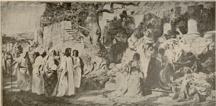
ესისო ქრასტე და მთქიფე ქალი.—სურ. სემირასკისა.

ვარსკვლავი-მრინეხველი დიდხანს სიცოცხლობენ. ვისაც სიცოცხლე სწუროან, იმან ვარსკვლავი-მრინეხველობას უნდა მიჰქოს ხელი. ინგლისელი სტატისტიკოსი, პროფესორი ჰოლდენი ამტკი-ნებს, რომ მეცნიერთა შორის ვარსკვლავი-მრინეხველი უველახე დიდ-ხანს სიცოცხლობენო. ადამიანის სიცოცხლის ხანგრძლიობის გამო-სახატავად სმეფლო რიცხეს თუ ჯილდობთ, ეს რიცხეი 33 წელიწადს არ აღემატება. ჰოლდენს ვარსკვლავი-მრინეხველთათვის ასეთი სმეფლო რიცხვად 74 წელიწადი მიანია, დიეტრატორთათვის—60 წ., ხოლო არტისტთ თვის 59 წელიწადი. 1000 ვარსკვლავი-მრინეხველიდან 596 კაცმა 70 წელიწადი იცოცხლა, 206 კაცმა 79 წ., 129—80 წ.