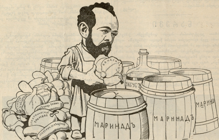
აქ მზადდებს საუკეთესო წნიდი.