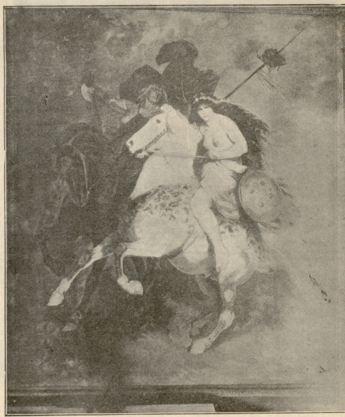
ამირამდეა საქართველოში. — გადაღებულია ტუფაისის მუსეის კვლადან.

ნჩესკო! — შეწყვირა დედამ და გიტაცებით დაუწყო კოცნა დახუტულ თვალთა და გალურჯებულ პაწია ტუჩებს: — ჩემო ძვირფასო შეილო!