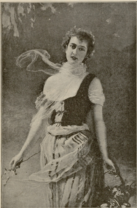
გუგაფელას გამაღაფია.— სურათი ტამბლის.

ქალმა კარსა ნიშნად თავი გაიქნია მხოლოდ. ახალგაზდა ქალის სიტყვების შემდეგ მგზავრი ერთმანეთს მოუღუპნენ.