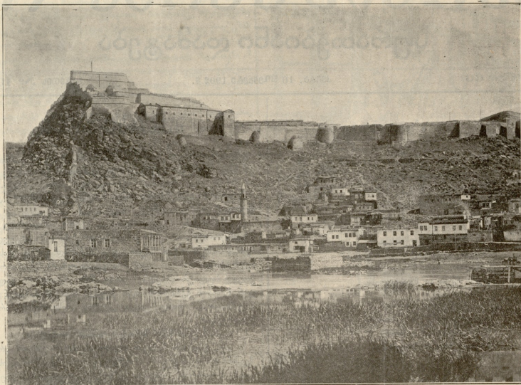
ქ. ეარსა, ადებული 25 წლის წინაჲ.

ამსობაში აღმოსაფლეთისკენ გამოჩნდა ცისკარი. იგი თავის შუქით თანდათან ანათებდა ცას და დღეამიწას; ოქროს ფრად ჰღებავდა სარკის მსგავს ტბის ზედა პირს, მაღალ