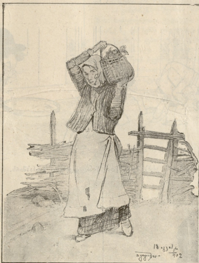
გენახადაან. — უსკაპი ა. კოვასჰილანის.