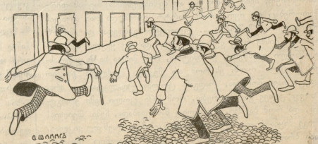
ტელიისის ახლა სმოსანთა გულმოდგინებთა. ზირეულ გრებასე მიეჭსრებთან

ელექტრონიკის გამოყენება 1922 წლის დანია.