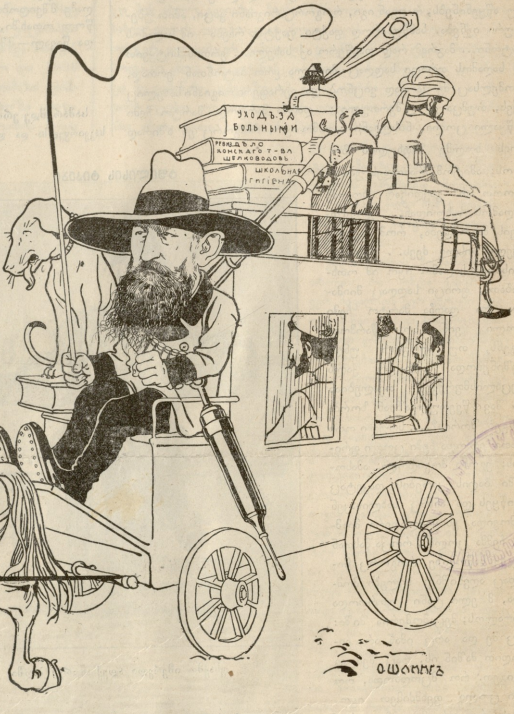
ვევლეთის მგობნე, ვევლეთის მისამე.

ადარ არის მერეფასი თვლები. უსწორარის დროიდან ასეა რომ ძვირფას თვალს რომი ექსინს, მრითა დიდ ფასში იუადებოდა და თუდებს ედერ: სოფელით თვალის იხეიბა, რომ ფასიც არ აქვს