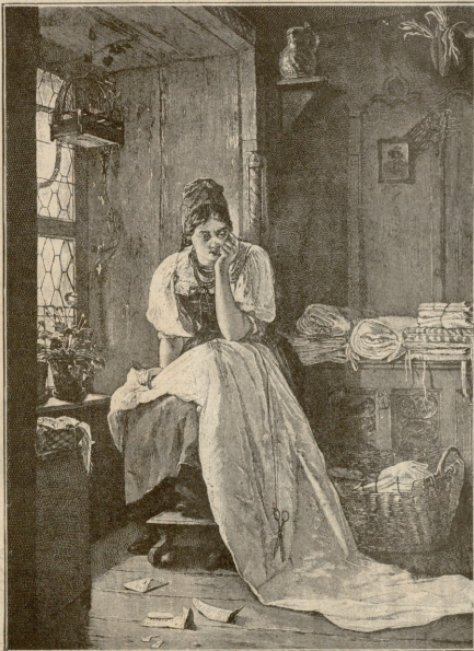
წერაღამა დააიქვრა. — სურათი გ. ჭენიხის

მასწავლებლის თანაშემწემ მიუ-ახლოვდა, რომ კიდევ გაესინჯა ხელთანწერი და ვაოცდა, რო-დესაც შეამჩნია, რომ ქაღალდს ზვიდან კუთხე მოხეული ჰქონ-და. წინად, როდესაც ეს ქაღალ-დი აჩვენა, კუთხე თითქოს მო-ხეული არ იყო; ვინ იცის, იქ-ნებ ფილიბინის სველი თითები ეფარა ამ მოხეულ კუთხეს... მი-ნოტიც კოტა ხანს დაფუქდა, მაგრამ მესხიერებამ უმტყუნა და ესლა გადაპრით ველარაფერს იტყოდა.