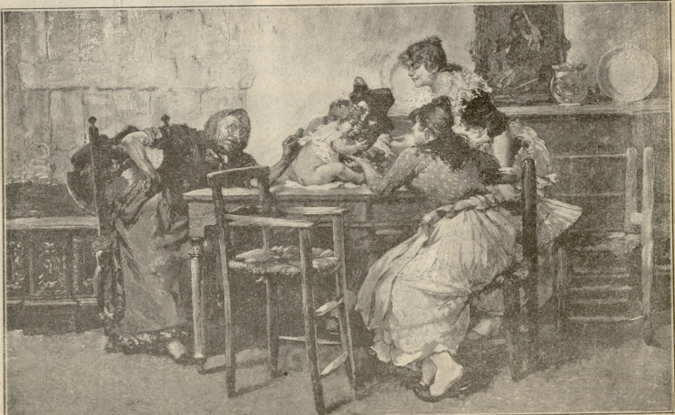
ეველას საყვარელი. — სურათი დანკერტოსი

„სიყვილის ჩრდილი თვალს უზენელებს დიდებულ რამესს. გამოგზავნა შენთან და მიიხარა: აწადი ჰორუსთან და