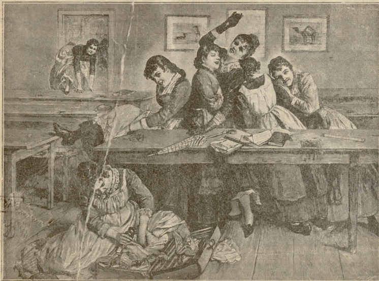
გაკვირვებების შემდეგ.—სურათი შაიერის.

ამბობდნენ და ღელში ამაყობდნენ—თვის მიუღვამელო-ბით თავი მოჰქონდათ.