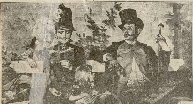
უნაყოფია ხლერსა. — სურათი ფან-მარეტისა.

— მე მალაპარაკებო ჩემი ურვეელი რწმენა, რომ ბუნებას ფრინველნი უაზროთ კი ვაზა, მაღალი მიზნებისთვის მოუწყვეთა ცხოვრებაში. ჩვენ უნდა ვიბრძოდეთ დაუღალავად, შეუფერხებელი; ვიბრძოდეთ, რომ ყველაფერი დასჯახნოთ, ყველაფერს ესძლიროთ და ჩვენს საკუთარს თვალშივე გავმართოდეთ, რომ შეგვექმნოს სქვა: ჩვენი წარსული, აწმყუდა და მომავალი — ჩვენნი ვართ ჩვენი შევადგენთ ყიფოა ამას და არა