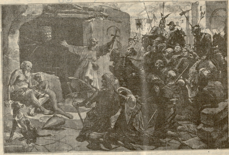
გვარისკება პუტლემში ქრისტეს შიშის დღეს. — სურათი კარხმალისა

— ვინ ლევანამა? — შეეკითხა მამასახლისო. — აი, იგუშვარანთ ბიჭმა! — თეკლეს შვილმა? — დიახ, შენი კირიმე! — ბურგაკი!... ამა შეც ვე მინდოდა, აი! — კმაყოფილ-ბით წამოსთქვა მამასახლისმა. — მაშ იყო, რა გითხრა,