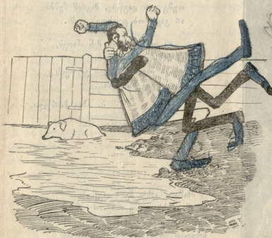
ენახით ვინ ახლანებს!