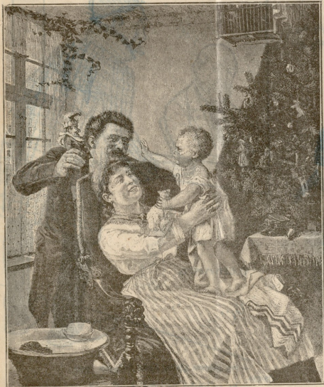
შობას სე.— სურათი თენეისა

როგორც უწინ, როდესაც კი შვილები მეთის ტირილით სკამეს გაუკვირებდნენ ხოლმე და ისიც აუბას მოგონებით აზრ-