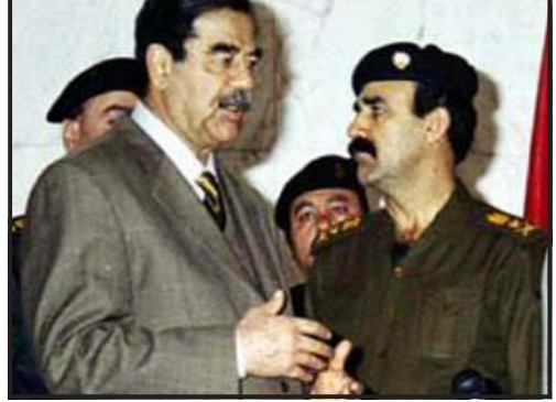
სა. 300-400 მილიონი ერაყული დინარი. მე-4 დღეების სარდალმა გენერალ-მაიორმა რეიმონდ ოლდენომ...