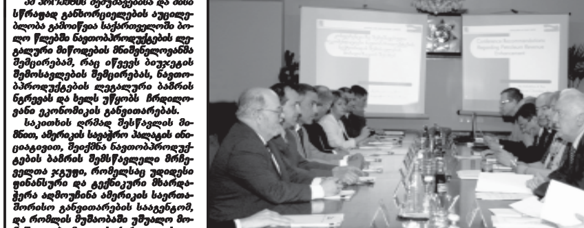
საქართველოს პრეზიდენტის მიმართული პრესკონფერენცია...