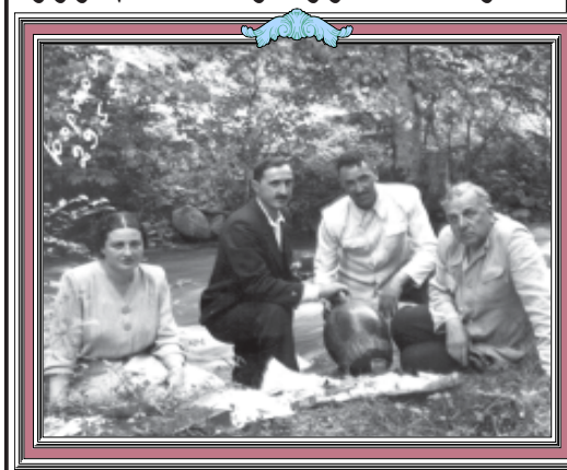
მომხრე მწერალი (მარჯვნივ) ბორჯომში, ახლობლებთან ერთად. 1950 წელი.