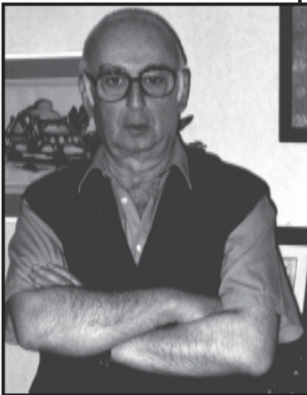
სორკიანი სიტყვანი... მარადი მოწევი...