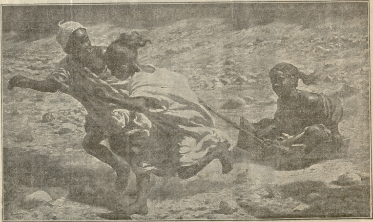
ემაწავლებლის თამაშობა.—სურ. დანტისი.

— მასწავლებლის თანაშემწეს, მინორსაც ძალიან უყვარს თავის უფროსის ხანგრძლივი ძილი იმ დღისას. მართლაც, გასა- კვირველია იმ კაცის საქმე! რაღა სწორედ იმ დღეს ვახდა ვა-