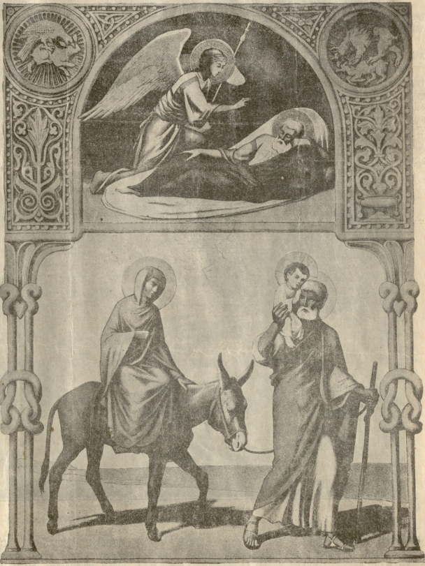
აქა ანგელოსი გამოუნდა ჩვევითი იოხანეს და ჩვე: აღსეც და წარიყვან ყრმა იგი და ღელა მისი და იგლყოლე გვიკეცედა. (სახ. მათ. II—13) ღილილი იგი აღსეცა და წარიყვან ყრმა იგი და ღელა მისი დამე, და წარიყვან გვიკეცედა. (სახ. მათ. II—14). ეს სურათი გადმოღებულია ზ. გვარამიის მიერ ეკლესიაში დატეულ ძველ სახარებთან.

ამ დროს შემოიტანეს გავთი „პატარა ბომონტი“, რომელიც იმ დამეს დაბეჭდილიყო. მარკოზმა სიამოვნებით ამოიკითხა მველლობის შესახებ კორკპონდენცია, რომელშიც სიმონს კარგის მხრით იხსენიებდნენ, ეწერა, რომ ყველასგან პატივცემულ მასწავლებელს სიმონს ყოველის მხრიდან დიდი