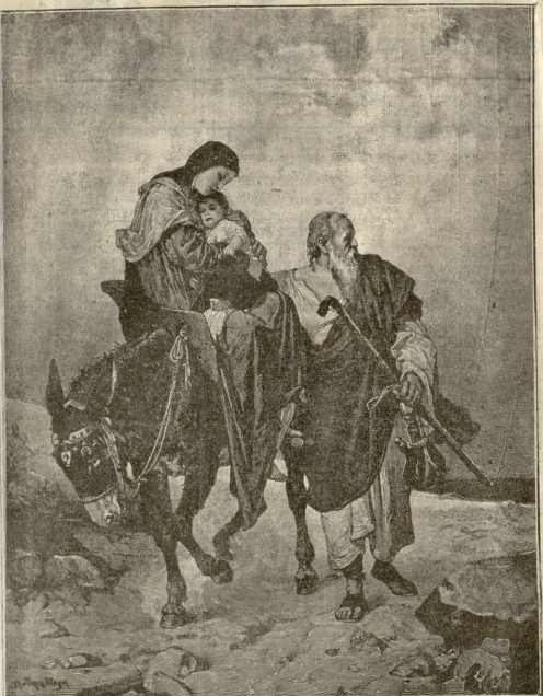
ბეთლემში დტოვლება: — სურათი ლეზენ-მთერის.

წინდაწინვე რომ არ ყოფილიყო იმის სიმაართლეს დარწმუნებულო, მარტო ეს სცენა და ეს გავგონილი სიტყვები საქმია იყო, რომ ყოველი ეჭვი გაშვანტოდა მარკოზს. მარკოზი თავის გულის თქმას აჰყვა და ორგვეს გადაეხვია, თითქო უნდოდა ეთქვა, რომ მე მთლად თქვენ გეკუთვნიო, რომ მეც დაგებმარბით, რათა თავიდან აიკლნიო ეს მძიმე განსაცდელი. რადგან მაშინვე უნდოდა საქმეს შესდგომოდა, ქალაღის ნიშუშე ჩამოუვლო ღამარაჯი. მარკოზი კარგად ჰგონობდა, რომ ამ ქალაღსა ჰქონდა მარტო დიდი შნიშენლობა, რომ ამ საბუთზე უნდა შემდგარიყო და აშენებულიყო მთელი საქმე. მაგრამ ვის შეველო მიმდგარიყო იმ საიდუმლოებსა, რომელსაც ეს დაქუქული, დაკენილი, დაღორბილი ქალაღი შეიკავდა, რომლის ერთი ყუიო თითოქო კბილით წაეგოჯა მსხვერპლს და რომელზედაც ქვეშ მოწერილი ხელი ან იქნება უბრალოდ დაღვინილი მელანი ნახვებრად წაშლილი იყო. იმ ქალაღზე დაბეჭდილი სიტყვებიცო — „ჯეყვარდეთ ერთმანეთო“ — თითქო საშართალს დასკინოდა. საიდან განნდა ეს ქალაღი? ბაგევის მოტანილი იყო, თუ მკვლელის? ვისთვის დადოთ ხელი, მაშინ როდესაც მღოშობის ქაღების მაღაზიაში ყველა კიდულობდა ამ ნიშუშს ქალაღს. სიშონს სეინიღისს ქვეშ მარტო