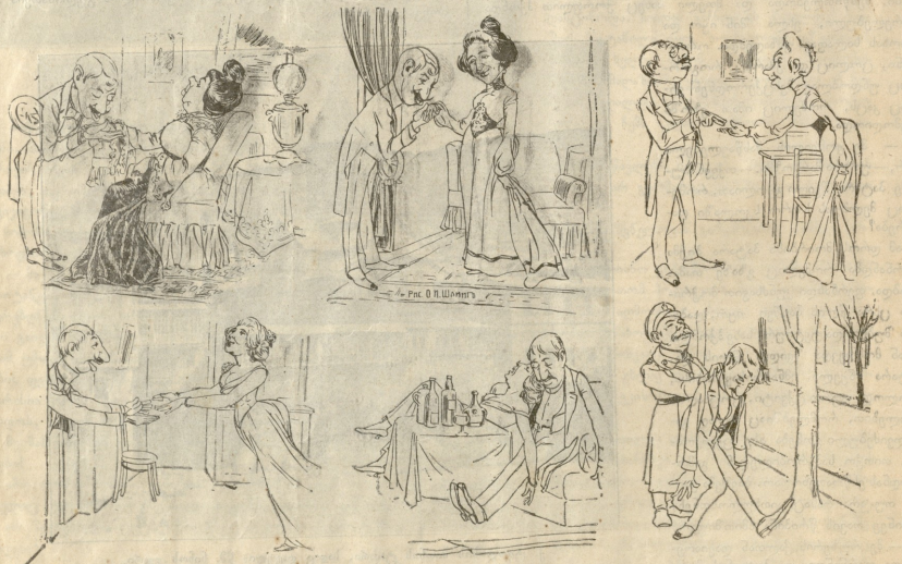
უფროსის თავიშო. გულის ვარდან