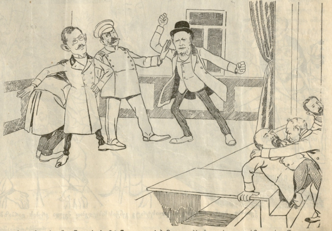
ქეთახსა, სენან, შავი-ქვის მარჯავლას კრებაზე. — აპპოზიციის ლიდერმა თავს უშველა.