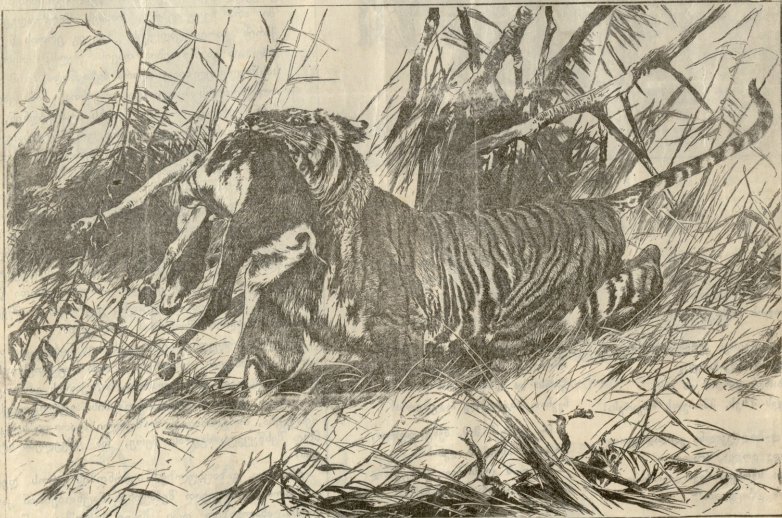
მძღაგამა უმანყო მსხვერპლი ხელთ იგლო.

...ოჰ, სტეფას რომ ასე ძალიან არ უყვარდეს, — დაიწებოთ იმეორება ქერივი, — მე ვაჩვენებდი სერის! — დედას კარლოსი უყვე შეჭიხიდა.