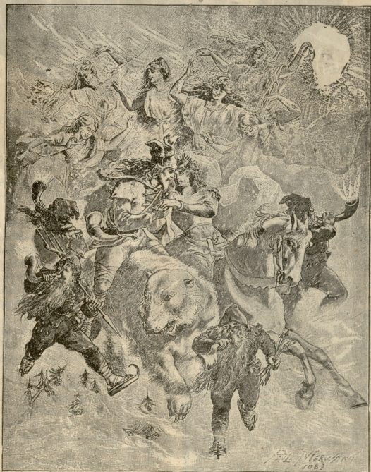
გარნაზუბი (ჩეგენბურნი ვეკლაერა). — სურათი მერყარისა.

— დამაბინჯებულო... — გაუსწორა გულგრილად პროფესორმა.