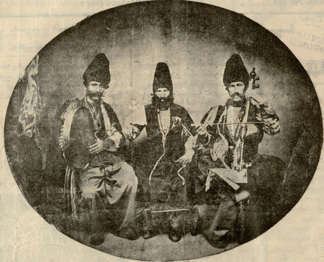
წარსულ დროიდან. გამაჩნიათ მიმდევრად სათარა და შევასწურე კვანკულა ტყეფისში.

— მაშ ასე; — განაგრძო კვლავ საქმიანის კოლოთი, — ჩვენი მოვალეობა თათურები ვადგენოთ ავადმყოფის სიკვდილის