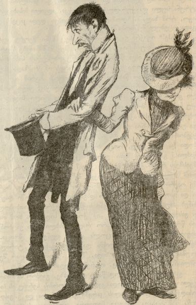
ერთის თვის ვეჯრ-დაწერილი.