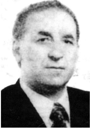
საქართველო (კოლხეთი) ჩვენი სამყაროს უპირველესი და უდიდესი ქვეყანაა. იბერიად იწვევა კოლხეთი, კოლხეთი კი საქრთული და მსოფლიო ცივილიზაციის სათავე. პროფ. ლევან სანიძემ (გაგრძელება. დასაწყისი "ილორი" №97, 98, 100, 101, 102, 103, 104, 105, 107, 109, 112)