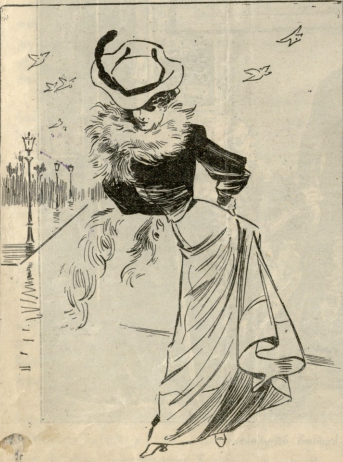
— თ... რს სამკალბათს ჩეიდიბე, პირველად ველადეკ ჩემს ქმარს! მაგრამ არა უმჯეს რა, ღეკ ეილდეს, რომ თუ ის დაღატეს გაჰედლებს — მე უშამ დესწარნი და გეღეფეს სამკაიეროსი გადებუხდი.