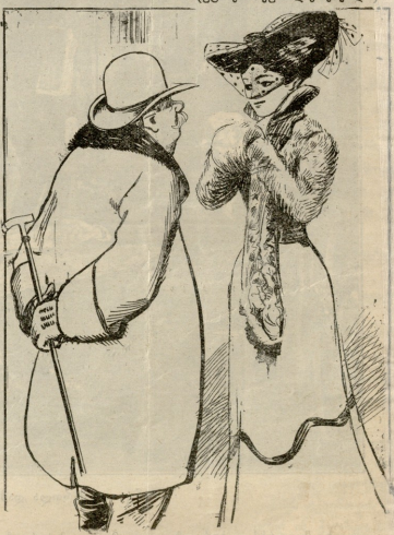
გატი. მევე ფულს მივეციდი იმ ქალს, ეინგ ჰინდად მე შემეგებდა და არა ჩემს ფულს. ქალი. რამდენს მომიგემო, რომ შევიფაროთ.