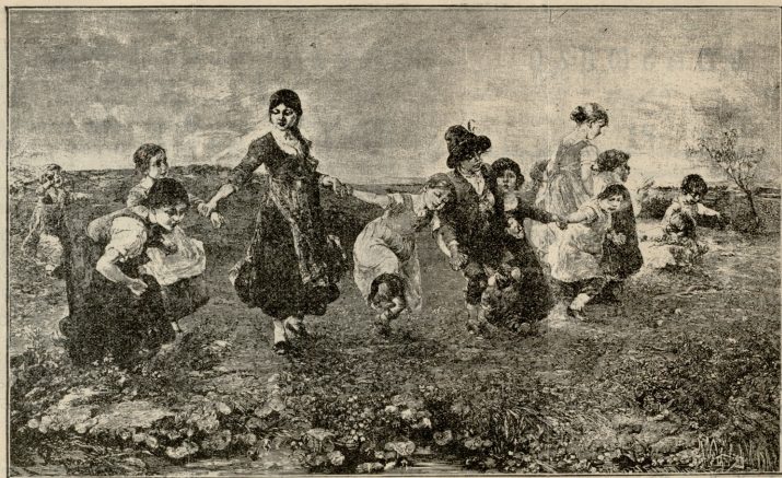
ფერხულა. — სურათი კეისერის

რედ ეხლა მოუნდა ლოგინუნდ დაწოლა. თითოეუ ჩემი ღირსი არ მეყოფოდეს, მომდგომია ჩემი სიდედრი, ვინდა თუ ექიმი მოიწვიეთ. საიდან? ვეკითხები. «თავში ქვა იცვ და იქ დანა... მე აქ ბების ფული არა მაქვს, ის ექიმსა შითხის, ამიტუნეს ომი, რომ არ დაეთანხმებოდ, სწორედ შეგემდენ მართალია, ჩემსა ცოლმა მწელი მოლოგინება იცის, პირველ ზედაც კინაღამ თან გადაჰყვა, მაგრამ რა ვქნა, საიდან?..» ადილი მისხვედრი იყო ვასილ ვასილიძის გაქირებუ ზახარი ზახარიშა უსამოვნოდ ცხვირის ნსტარება ვაბერ