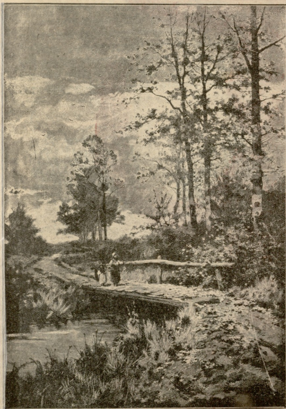
ბოკარზე. —სურ. სტანტანისა