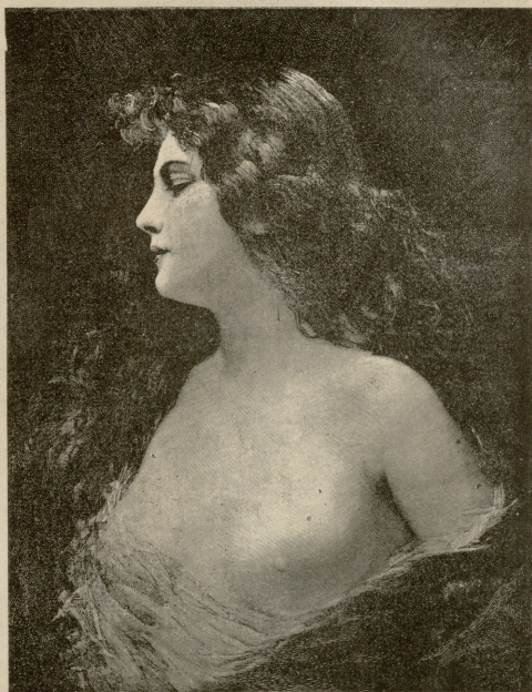
გასვლულა. — სურათი ისტისა.