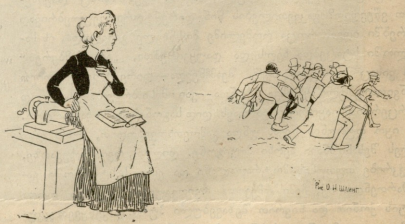
მას კურნობან ემაწვადი კატეხი.