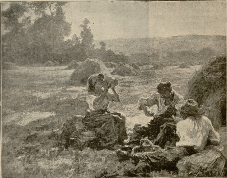
ვანაშია. — სოფლის სურათი ლეჩხუმისკენ.

— ერთობ მოგვებებრა ლათინურმა თავი. ერთ დღეს სულ არ მოგვიმზადებია გაცეითილი თითქმის მთელ კლასს დამწვევადევა გადავიწყებტეს. შიმშილი რომ თავიდან აგვეკლიებინა, ჩვენ გადავეცით უივარის ერთი ჰულდენი. ამ ფულით ათის წუთით დავსვენების დროს სადილი უნდა მოემზადებინა ჩვენთვის. ღირექტორი გასასვლელ კარებში იდგა, ამიტომ შეუშინველად ვასლა შევუკლებელი იყო. მაგრამ მოხერხებულ უივარი ღირექტორს ჩუბად გაუხსლტა ხელიდან იქვე ქუჩის პირას მებურის დუქანი იყო. უივარი იძულეზული იყო, მართო ბულკები ეყიდანა. სულ სამოც და თხუთმეტი ეროცო. ბედზე სერთუოკის ჯიბე ერთ ალავას გახებული ჰქონდა. უივარიმ მივიღი სურსათი სერთუოკის საჩულში მოათავსა... ასე დატვირთული დაბრუნდა საკლასო ოთახში, მაგრამ ცოტა დღევიანდა: ლათინურის მასწავლებელი უცე კათედრაზე იყო