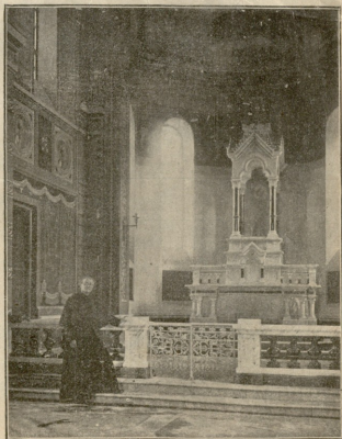
ბათუმის კათოლიკეთა ეკკლესიას შიგნით ხარა.

— ძალიან ადვილათ! წინათ, როდესაც ხობრიუკები ჩუმად მიდიოდა, ჩვენ იმას მძღვარის მკლავით ვიცნობდით ხოლმე. თუ მოსული ყველას კბილებში სცემს, მაშასადამე ეს უსათუოდ ხობრიუკოვია. პოსულდინს კი მსწრაფად ვიცნობთ ხოლმე უბრალო მგზავრს უბრალოდ უქირავს თავი, პოსულდინი კი ასეთი არ არის. ესთკვით მოვიდა რომელიმე პოსტის სადგურზედ, მაშინვე დაიწყებს: ეს—ვარს აქვებობაო, ეს სული მებუთება, მტკიავა... მოითხოვს მაშინვე: ვარისა, ბილფულობას, ნაირ-ნაირ მუჩაბას. სტანკიაზედაც იციან, რომ ვინც ზამთარში ვარობებს და ბილფულობას მოითხოვს, ის იქნება პოსულდინი. ვინც ზედაზედველს ეტყვის: ჩემო კაროა და მისთან სხვა და სხვა რამეებისთვის უბრალოდ მოსამსახურებს არბრინებს, მაშინ დაუფიცავდაც უნდა დაიჯეროთ, რომ ეს პოსულდინი იქნება. იმას სულ სხეინარი სუნე უღის და დაწვება ხოლმე თა-