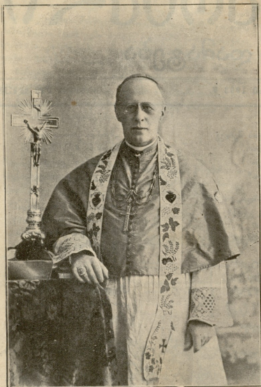
ბარონ ედვარდო როზბი კათოლიკეთა ეპისკოპოსი