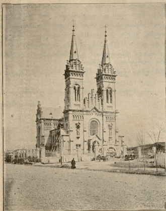
ბათუმის კათოლიკეთა ხსნაღა ეკკლესიას.

სუხავს ხოლმე... ადგება თუ არა ლოგინიდან, ჯერ თვალში არ გაუხელოა და ის კი მოითხოვს არასც და ყურბუკებს. ერთს უკიბს რომ მიუტანენ, მეორეს თხოულობს... ასე ამგვარად მთელი დღე სვამს. მერე თქვენ იფიქრეთ, სვამს და მიყუწდება. მაშასადამე თავის დაქერაც სკლდნია. როცა კი ჩვენნი ხობრიუკები დადგება, ხალხი არ და ძალღლებტი კი აყაყან-