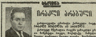
საქართველოს რეპუბლიკის მთავრობის მიერ...