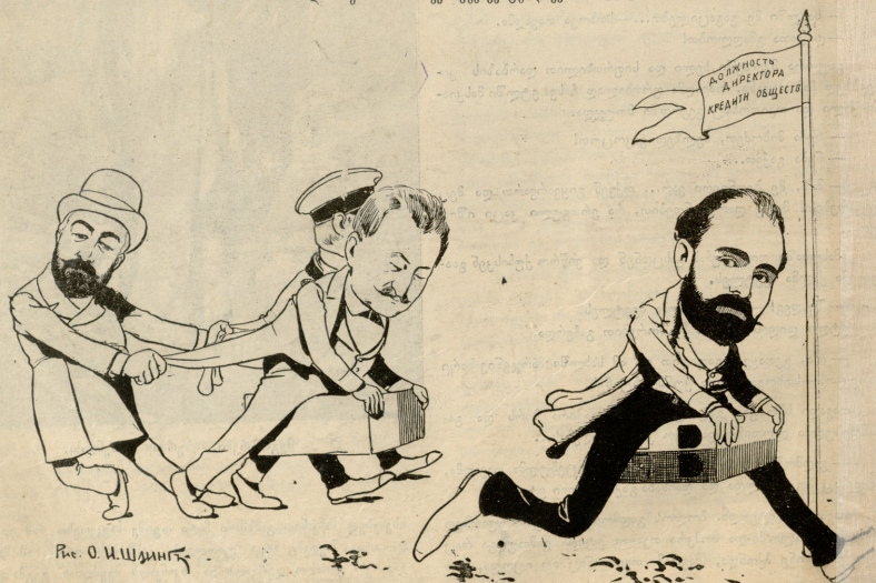
Рис. О. М. Шлинга