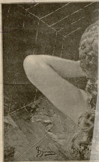
ღამის იბობა, — სურათი სპირიტუალის.

4 მხნეთი და 50 კაპ. ღირს უოველ დღიურ დაძატებით, 1 მანის