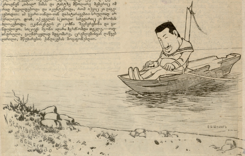
დ. მსხერეველ "არგონთოტის" მენავემ მშვიდობიან ნაყთსაუფელს მიაგნი.