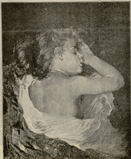
ტყილა ძილა.—სურათი ბანოელისის.

გადაპარებით დათუქავდა ფილოს, რომელსაც აქეთ-იქიდან მოკეცოლ ვეფრისთვის გადგოა ხელები, ოღნავ ნიკაპი დეყროლო კოლითაში მძინარე გოგონასთვის და შისცემოდა ამ კეკ-