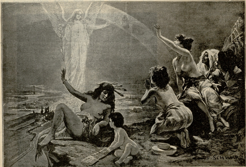
განათლავს მოლოდინში.—სერაიო შკარდის.

ფილომე ცული წელში გაიჭყო, ილიაში ამოიღო სო-მინის*) ნაჭერი და ცოგით გაუღდა ოშორის ტუსკენ. ვიდრე სიცივე კბენას დაუწყებდა, ფილო მიამიჯებდა ნე-ლის, გაუბედავის ნაბიჯით, მაგრამ როცა დაატყო, რომ სხეუ-ლი თან-და-თან უბრუნდებოდა, ნაბიჯს მოუმატა და ბუჭით გაუღდა გზას. უფრო აწუხებდა ცხვირ-პირი და ტანსა და მუხ-ლებზედ აქა იქ ჯუჯუტანებიდან მონანენი სხეული, რომლებ-ზედაც, როგორც იმას ვგონა, ბლუჯთ შეკრული ნემსე-ბი სჩხელტდა. დრო გამოშვებით შეჩერდებოდა, დაუწყებდა ამ ადგილეს სრესას და კარგად რომ გააწოთლებდა, უმაღ