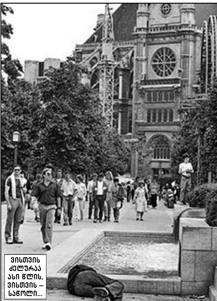
ვისთვის კელურა ასე წლის, ვისთვის - სანოლი...