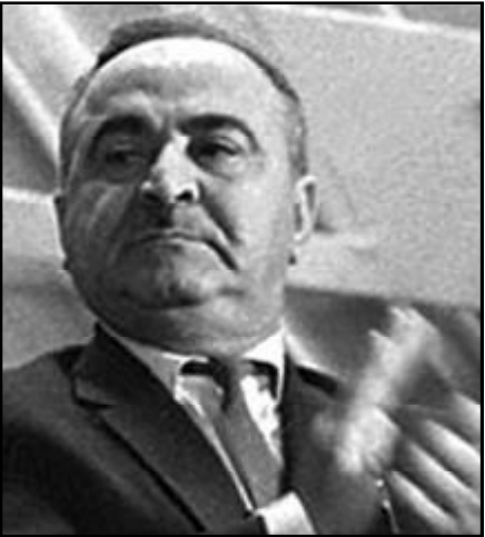
პიოტრ პოროშენკო, უკრაინის პრემიერ-მინისტრი.

ცნობამ იმის შესახებ, რომ ოდესის გუბერნატორი მისიელ სააკაშვილი, თითქოს, უარს ამბობს უკრაინის პრემიერ-მინისტრის პოსტზე დანიშნებაზე, იმათი ირონიული ლიმილი და სხვადასხვაგვარი მოგონებები გამოიწვია, ვინც მეტ-ნაკლებად იცნობს საქართველოს თანამედროვე ისტორიას და ამ ქვეყნის ყოფილი ხელმძღვანელის ხასიათს. შეგახსენებთ, რომ უკრაინის პრემიერდენტმა პიოტრ პოროშენკომ, როდესაც უპასუხებდა პეტიციაზე წინადადებით — დაენიშნათ ოდესის გუბერნატორი მისიელ სააკაშვილი ქვეყნის პრემიერ-მინისტრად — განმარტა, რომ ეს გადაწყვეტილება მასზე არაა დამოკიდებული. „უკრაინის კონსტიტუციის თანახმად, პრემიერ-მინისტრს ნიშნავს უმაღლესი რადა პრეზიდენტის წარდგინებით“, — ნათქვამია უკრაინის სახელმწიფოს მეთაურის პასუხში ხსენებულ პეტიციასთან დაკავშირებით. ამას გარდა, ზემოაღნიშნული პროცედურის დაწყების აუცილებელი პირობაა ამ თანამდებობაზე დანიშნვის კანდიდატის პირადი თანხმობა. „თუმცა, სააკაშვილს ამ საკითხთან დაკავშირებით არ გამოუთქვამს“, — დაუმატა პრეზიდენტმა. ერთი სიტყვით, თავად არ უნდა!