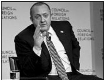
აღნიშნული საკითხზე საუბარი იყო საგარეო ურთიერთობათა საბჭოში საქართველოს პრეზიდენტის გამოსვლისას, ხოლო შეხვედრის შემდეგ გიორგი მარგველაშვილმა პუბლიკაციების შეკითხვებს უპასუხა.

საბარტემელოს პრეზიდენტი გიორგი მარგველაშვილი იზიარებს მოსაზრებას, რომ საქართველოს საკითხი საქართველოს რადარებიდან გაქრა