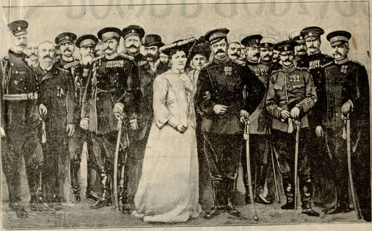
პოლონური ნაღებანი, გენერალი კინცარამარკოვიჩი მინისტრი-პრეზიდენტი, დედოფალი დრავა, მეთვალყმარე პრინცესა მლენე, ნიკოდი ლენგვიჩი, დედოფლის შვი, გენერალი ღაზაბ ბატალიონი.