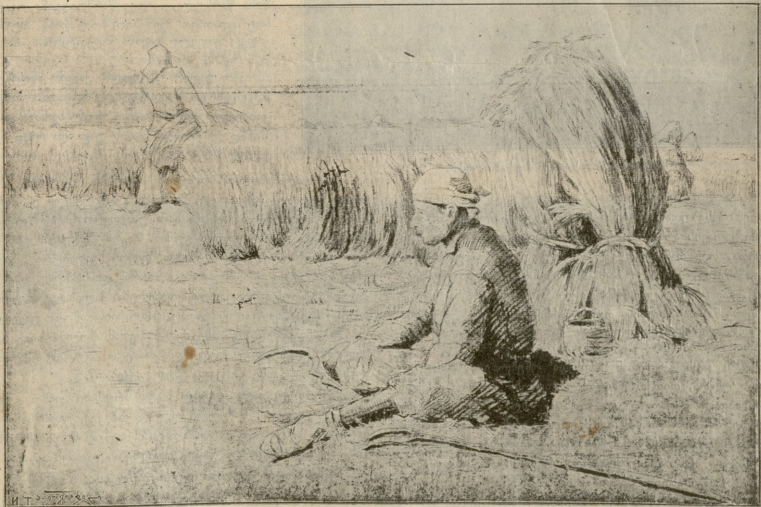
კანაში, = კეხიში გოჯააწილისა.

ხშირად ვაგი შეფიქრებით იყო მოკლული და უიმედობის კმუნვა გულს უღრღნიდა, უკლავდა, მაგრამ არც მან შეამჩნევინებდა ქალს თავის მუხუარებას და მაინც კიდე ჩემოდ თვალ-ყურს ადევნებდა, როდესაც ის გარემომორტყმული თავისის მკვლევებით ნიავეით მიჰქროდა ბალის ხევიანში და მომხიბლავის სიკელტული ისურებდა მოხდენილ ტანისამოსს. ამ დროს ის ჰგავდა რიგანასა და მზურველ მასპინძელს, როგორც ერთსა და იმავე დროს სასოვადლოებასაც ართობს და თავის ოჯახის წერილმან საქმეებსაც არ იფიქრებს.