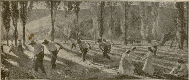
თბილისი.—სურათი ჰანრა მარტინის.

„დედასთან მოლაპარაკება... დიხს, ეს საჭიროა, მაგრამ მერე?“ ამ სიტყუაზე ვაქვი ისევე ოცნებას მიეცა. წარმოიდგინა, თუ როგორ დაბინადებდნენ ორგენი ერთად. ამ მომავალმა ახალმა მდგომარეობამ კიდევ უფრო გამოუტყვევებ მო-