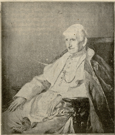
რომის შაჰი ღეორგე VIII, რომელიც ამ გამად ძალაშია ახად არის.

თი, სწორედ იმ კურთხეულ ღროს ადამიანები ერთ დიდ დინაგრიბლის ძირებაში სცხოვრობდნენ. ლეგენდა არ გვეუბნება, სად ან რომელ ქვეყანაში იყო ამ ადამიანების საცხოვრებელი. ან-კი რა საჭიროა ამისი ცოდნა? განა, სულ ერთი არ არის დედამიწის რომელ ნაწილზედაც უნდა ეცხოვრათ? ჰო, იმ დღის ძირებაში სცხოვრებდნენ. ღმერთმა ნუ მოვიზოლოთ იმ გვარი უშფოთველი და უღარდელი ცხოვრება,