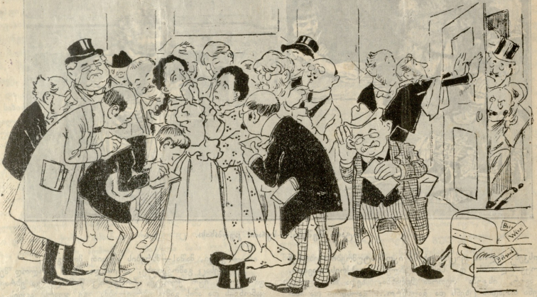
სერბის მოკლედი დელოფის დრაცას დები საზღვარ კარეთ, კორრესპონდენტების ხელში.— ისევე სერბიულების ხელში ყოფ- ნა სჯობდა, კორრესპონდენტების გასაწეწად ზე წამოსკადას!

— მიღებოა? კ. გიუნაშვილი. (შემდეგი იქნება)